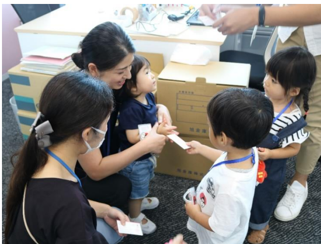
【社内ツアー】社内をまわり、職員と名刺交換を行いました

JPホールディングスでは今後も、家族間、職員間のコミュニケーションを促進することで、より働きやすい職場環境づくりにつながる取り組みを進めてまいります。