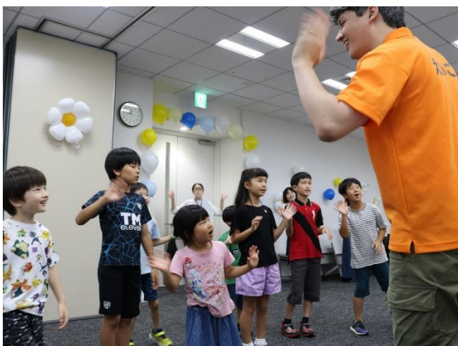
【キャストプログラム】体を動かし、楽しみながら「えいご」「おんがく」等を学ぶ体験をしました