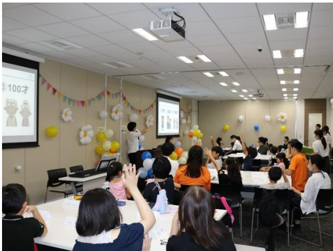
【会社クイズ】JPホールディングスグループのお仕事についてのクイズを解きました