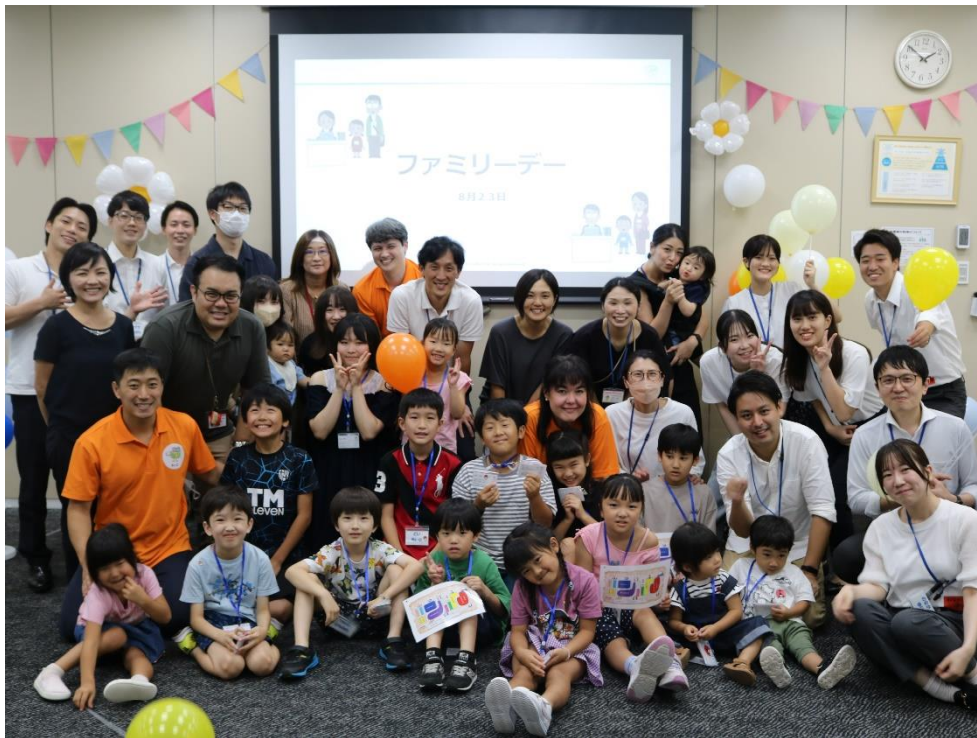
職員とその家族、職場で働く仲間との絆が深まる1日になりました

当日は、会社クイズやお仕事体験、グループ傘下の株式会社日本保育総合研究所が開発した「えいご」「おんがく」等のキャストプログラム体験、社内ツアーなど子育て支援企業ならではの様々なプログラムを行いました。